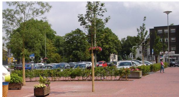
Neugestalteter Parkplatz Am Neutor Umgestaltung in 2012- 2013

Auch in die Zukunft wird investiert - nach 25 Jahren Dauerbetrieb wird die Tiefgarage am Kreisverkehr aktuell saniert und auf den neuesten Stand gebracht.