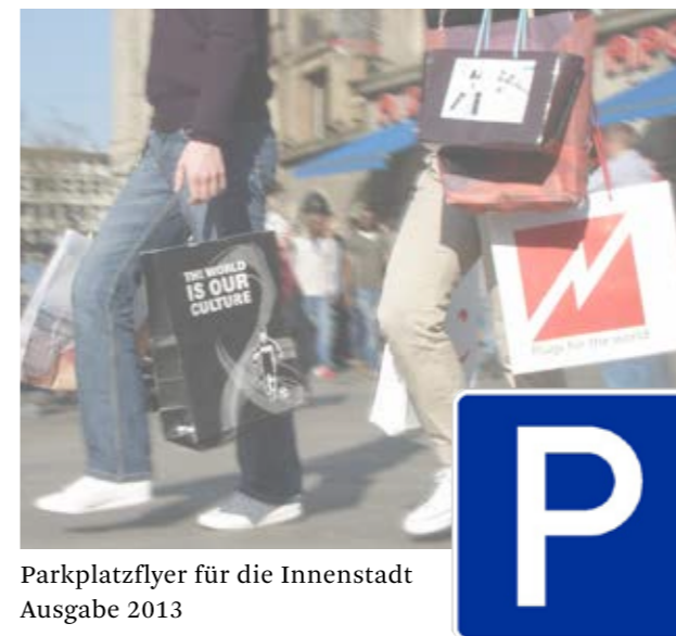
Parkplatzflyer für die Innenstadt Ausgabe 2013

Besuchen Sie die Dinslakener Innenstadt! Wir sind für Sie da: über 200 Geschäfte, Boutiquen, Restaurants und Cafés!