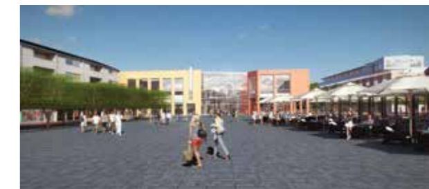
Neutorplatz mit Blick auf die Neutor Galerie

Wir möchten Sie in der Umbauzeit in der Innenstadt aktiv begleiten und über alles Wissenswerte informieren.